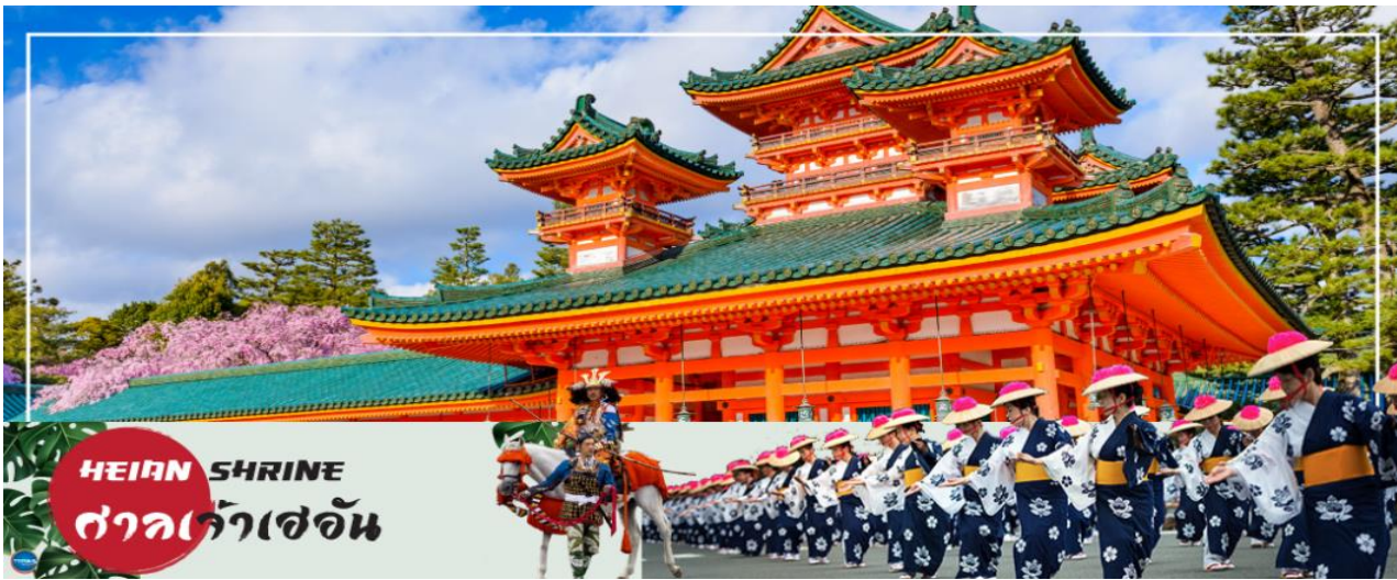
HEIAN SHRINE ศาลเจ้าเฮอัน

วันที่สี่ เมืองนาโกย่า – เมืองเกียวโต – ศาลเจ้าเฮอัน – การเรียนพิธีชงชาญี่ปุ่น – เมืองโอซาก้า – ศาลเจ้านัมเมะยาซากะ – ช้อปปิ้งชินไซบาชิ