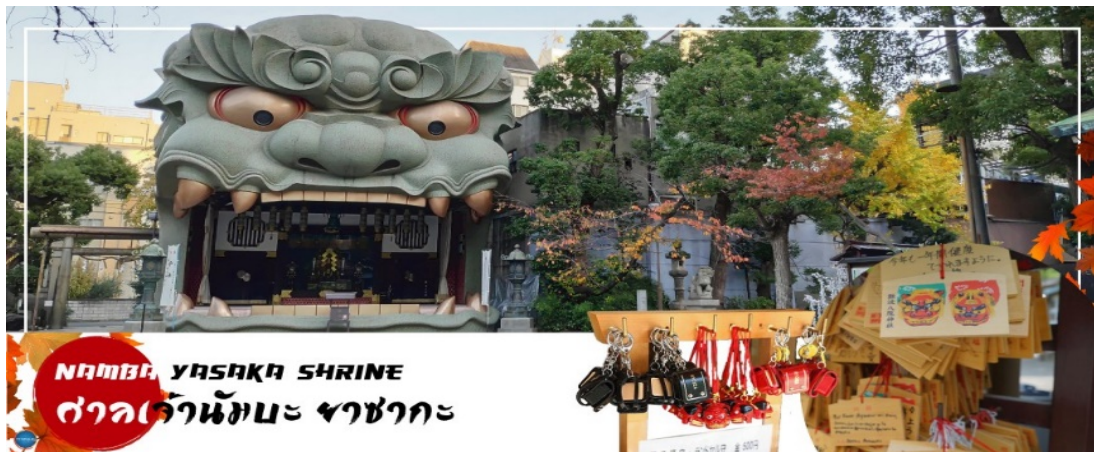
NAMBA YASAKA SHRINE ศาลเจ้านัมเมะ ยาซากะ

เดินทางสู่ เมืองโอซาก้า (Osaka) (ใช้เวลาเดินทางประมาณ 1 ชั่วโมง) เมืองที่มีขนาดเศรษฐกิจใหญ่เป็นอันดับ 2 และมีประชากรมากเป็นอันดับ 3 ของประเทศญี่ปุ่น ตั้งอยู่ในภาคคันไซบนเกาะฮนชู ประเทศญี่ปุ่น ปัจจุบันเมืองโอซาก้ามีสถานที่ท่องเที่ยวมากมาย มีแหล่งช้อปปิ้งยอดนิยม มีสวนสนุกขนาดใหญ่ ทั้งยังมีอาหารที่เป็นเอกลักษณ์ เช่น ทาโกะยากิ โอโคโนมียากิ (พิซซ่าญี่ปุ่น)