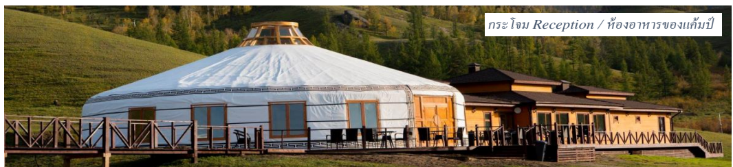
กระโจม Reception / ห้องอาหารของแคมป์